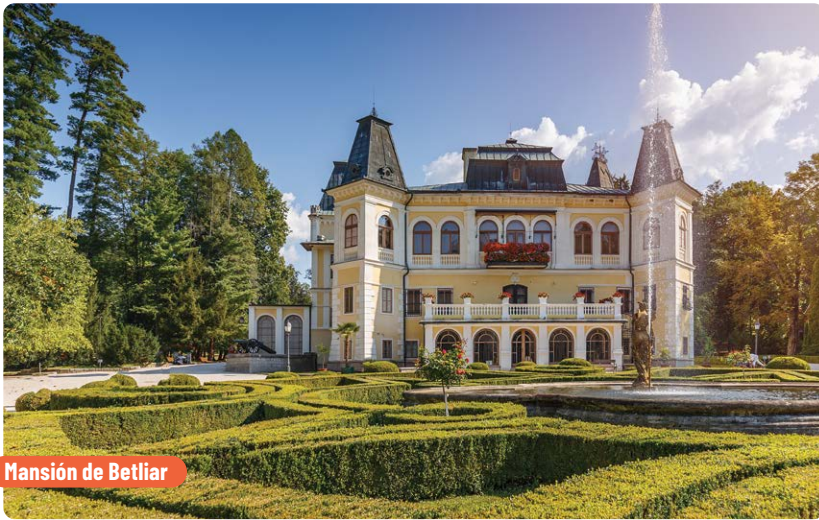
Mansión de Betliar