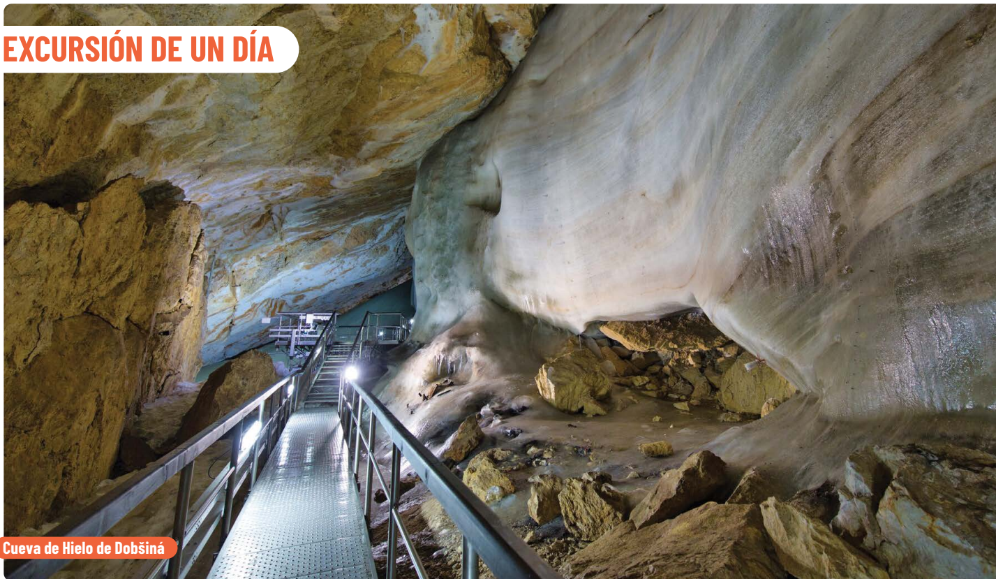
Cueva de Hielo de Dobšiná